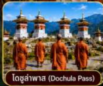
โดจุลาพาส (Dochula Pass)