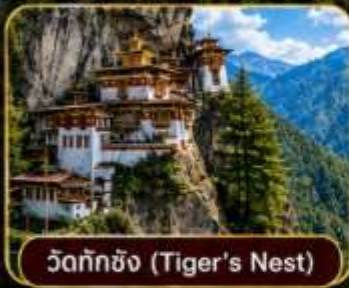
วัดทักซิง (Tiger's Nest)