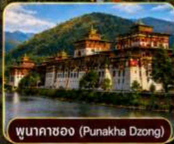
พูนาคาซอง (Punakha Dzong)