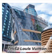
ตึกโร้ Louis Vuitton

เดินทาง : กรกฎาคม - ธันวาคม 2569 **ราคาไม่รวมตั๋วเครื่องบิน**