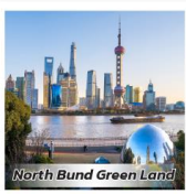
North Bund Green Land