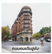
ถนนคนเดินซุ่ฉง