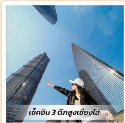
เช็ควิว 3 ตึกสูงเฉิงชงไฮ