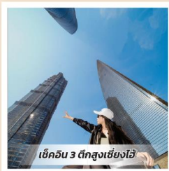
เข็คอิน 3 ตึกสูงเซียงไฮ้

** เนื่องด้วยรัฐบาลท้องถิ่นมีนโยบายอนุรักษ์สิ่งแวดล้อม ทางโรงแรมจึงไม่มีบริการ ยาเสพติด แปรงสีฟัน แชมพู ครีมนวดหน้า **