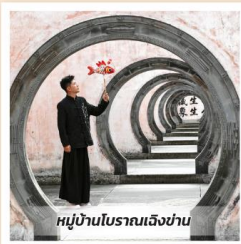
หมู่บ้านโบราณเจียงชาน