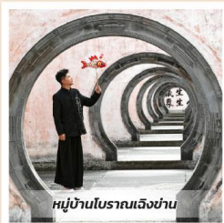
หมู่บ้านโบราณเฉิงชาน