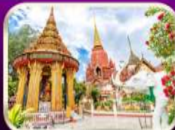
หอพระหลวงปู่ทวด วัดช้างให้