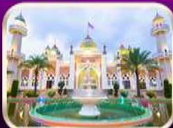
ชมบึงฮีดกลางปัตตานี