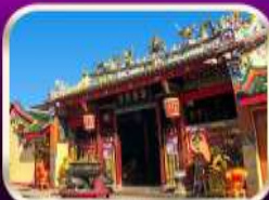
ศาลเจ้าแม่ลิ้มกอเหนี่ยว

ที่เที่ยวเพิ่มขึ้น และ ช่วยฟื้นฟูเศรษฐกิจขนาดใหญ่