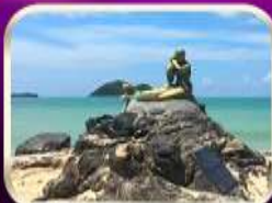
เที่ยวหาดสมิหลา สงขลา