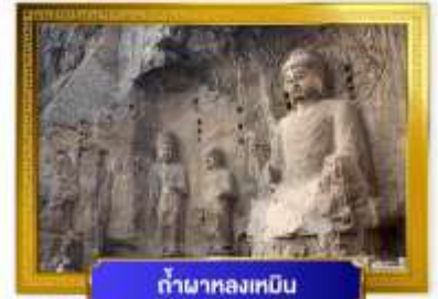
ถ้ำผาหลงเหมิน