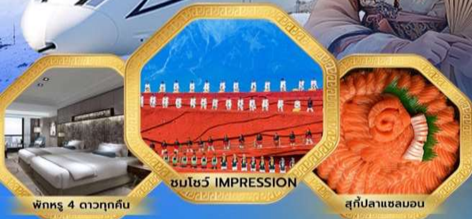
พักรู 4 ดาวทุกคืน