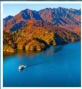
ล่องเรือชมทะเลสาบโศคุทาดามิ