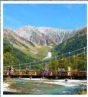
คามิโคจิ