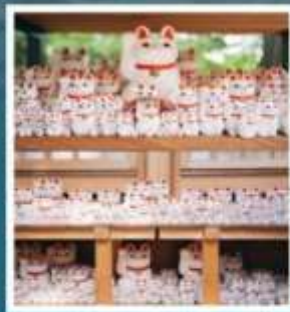
วัดโกโตคุจิ