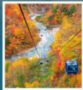
ดราคอนโดล่า