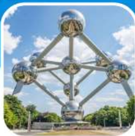
ช้อปปิ้ง มหานครปารีส

ล่องเรือชมแม่น้ำโรนน์ เมือง เซนต์กอร์ - บ็อบพาร์ด ชมเมือง โคโลญน์ มหาวิหารโคโลญน์ เที่ยวเมือง กิ์รูน ล่องเรือ ชมหมู่บ้าน ชมเมืองโวเลนดัม ซานสคัน อัมเตอร์ดัม เมืองหลวง เนเธอร์แลนด์ ล่องเรือหลังคากระฉก ชมสถาบันเพชร ล่องเรือชมเมืองบรูจจ์ บรัสเซลส์ ชมอะตอมเมียม ชมเมืองเก่า เข้าสู่ปารีส เข้าพระราชวังแวร์ซายย์ อิสระช้อปปิ้ง ล่องเรือแม่น้ำแซนต์