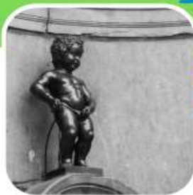
โรงแรมที่พัก 4 ดาว

ออกเดินทาง กันยายน 2568 - กุมภาพันธ์ 2569