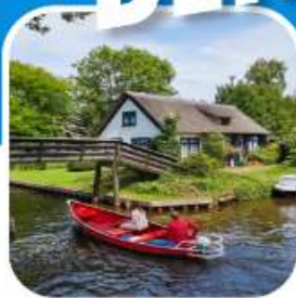
ท่องเที่ยวครบ ตลอดการเดินทาง