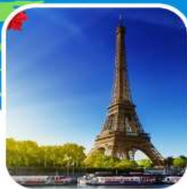
อาหารพิเศษเมนู พื้นเมือง