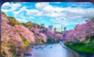
Chidori ga fuchi sakura