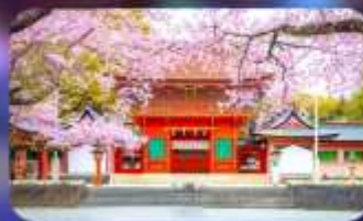
Fujisan hongu sengen taisha