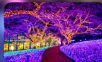
เทศกาลประดับไฟซากามิโกะ