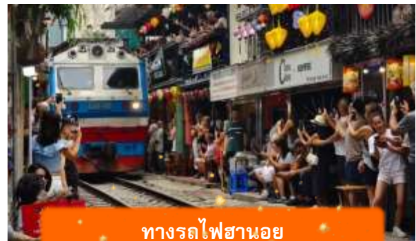
ทางรถไฟฮานอย

เช้า บริการอาหารเช้า ณ ห้องอาหารของโรงแรม นำท่านเดินทางสู่ วัดเจ็ญกั๊ก วัดริมทะเลสาบที่เก่าแก่ที่สุดในฮานอย สงบ สวย และ สะท้อนวัฒนธรรมเวียดนามได้อย่างลึกซึ้ง หลังจากนั้นนำท่านเดินทางสู่ ทางรถไฟฮานอย เป็นแหล่งท่องเที่ยวที่ได้รับความนิยมในกรุงฮานอย ประเทศเวียดนาม จุดเด่นของที่นี่คือ ทางรถไฟที่วิ่งผ่านย่านชุมชนที่อยู่อาศัย ทำให้เกิดภาพวิถีชีวิตที่แปลกตาและเป็นเอกลักษณ์ ท่านสามารถทดลองชิมกาแฟแท้จากเวียดนามได้ที่นี้ อาทิ กาแฟนมเวียดนาม ที่มีความเข้มข้น กาแฟไข่มุกนมสดหอมละมุน หรือกาแฟเกลือที่ทำให้ความรู้สึกแปลกแต่อร่อย อย่างบอกไม่ถูก (ไม่รวมค่าเครื่องดื่ม)