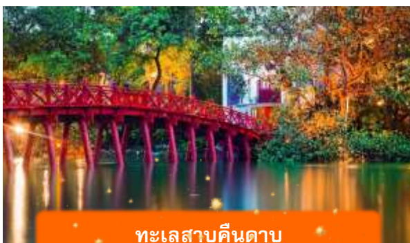
ทะเลสาบคินดาบ

ที่พัก A25 HOTEL ระดับ 4 ดาวมาตรฐานท้องถิ่น หรือเทียบเท่า