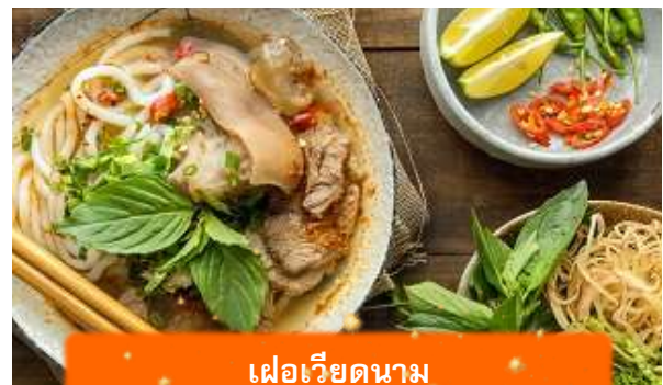
เฟอเวียดนาม

เที่ยง บริการอาหารกลางวัน ณ ภัตตาคาร พิเศษ ... เมนูเฟอไก่เวียดนาม ได้เวลาอันสมควรนำท่านเดินทางเข้าสู่ สนามบินนอยไบ เพื่อเดินทางกลับประเทศไทย 15.55 นำท่านเดินทางสู่ สนามบินสุวรรณภูมิ ประเทศไทย เที่ยวบินที่ VN619 (บริการอาหาร และเครื่องดื่มบนเครื่อง)