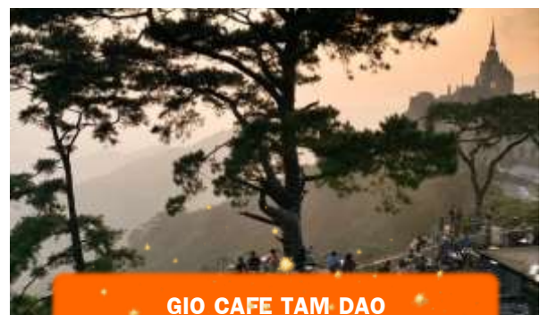
GIO CAFE TAM DAO

นำท่านเดินทางสู่ GIO CAFE TAM DAO คาเฟ่ชื่อดังบนยอดเขาที่เปลี่ยนกาแฟถ้วยหนึ่ง ให้กลายเป็นประสบการณ์สุดพิเศษ ด้วยทำเลที่มองเห็นวิวเมืองตามดาวจากมุมสูง GIO Cafe จึงเป็นจุดหมายของทั้งสายถ่ายรูปและสายชิล ไม่ว่าจะเป็นระเบียบกระจกที่ยื่นออกไปกลางทะเลหมอก หรือที่นั่งริมหน้าต่างที่เห็นทิวเขาซ้อนกันไกลสุดสายตา ที่นี่ไม่ได้ขายแค่เครื่องดื่มดี ๆ แต่ขายความรู้สึกของการอยู่เหนือเมฆ ไม่รวมค่าเครื่องดื่ม