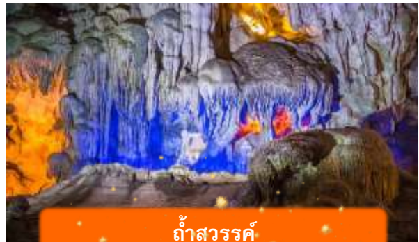
ถ้ำสวรรค์