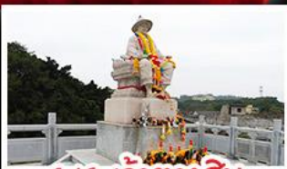
พระเจ้าตากสิน