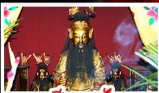
เซียงบูชิว