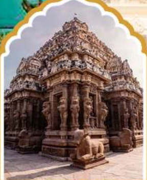
กาญจิปรัม