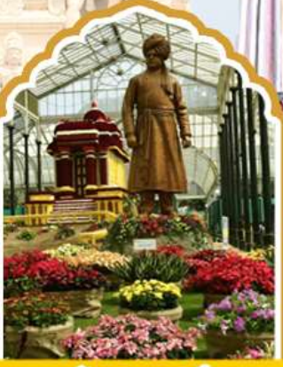
บังกาลอร์