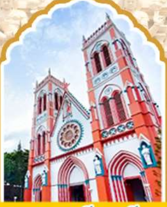
ปอนตีเซอรั