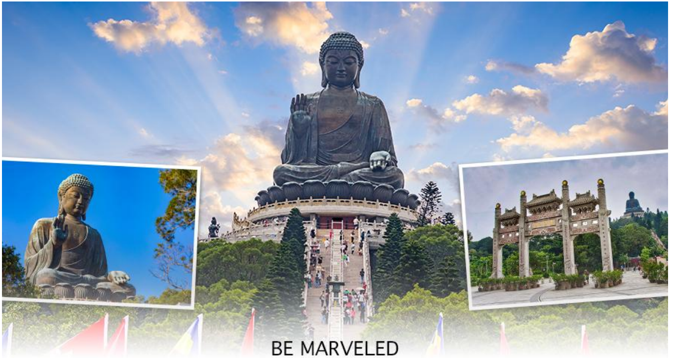
BE MARVELED พระใหญ่เทียนถาน

☉ อีสรอาหารเย็น เพื่อความสะดวกในการขอปิ้ง