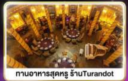
กานอาหารสุดหรู ร้านTurandot