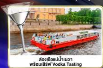
ล่องเรือแม่น้ำเนวา พร้อมเสิร์ฟ Vodka Tasting