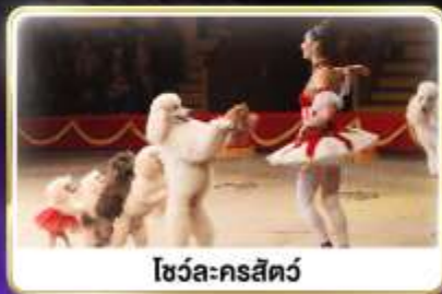
โชว์ละครสัตว์