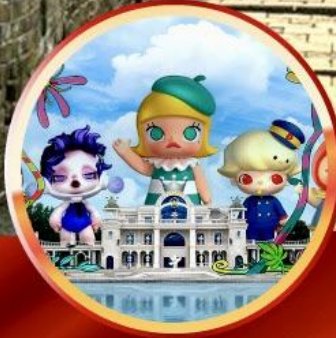
สวนสนุก POP LAND