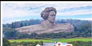
เกาะซั่มจวีจิว