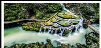
แกรนด์แคนยอนกงเหริน

เขาฟ่านจิ่ง - เมืองโบราณฝูเถียงจีน เมืองโบราณเฟิ่งหวง - เกาะซั่มจวีจิว แกรนด์แคนยอนกงเหริน - ไม้เข้าน้ำร้อน พักโรงแรม 5 ดาว - รถไฟความเร็วสูง