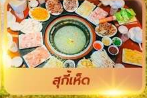
สุกี้เด็ด