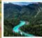
อุทยานคานาสือ