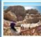
เขาวังถาทะเล