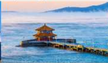
สะพานจันเจียว