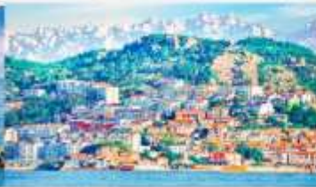
หมู่บ้านชาวประมงซาจื่อโซ่ว