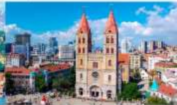
โบสถ์คริสต์เซนต์ไมเคิล

*ทางบริษัทฯ ขอสงวนสิทธิ์ในการสลับโปรแกรมทัวร์ตามความเหมาะสมขึ้นอยู่กับสถานการณ์หน้างาน โดยคำนึงถึงผลประโยชน์ของลูกค้าเป็นสำคัญ