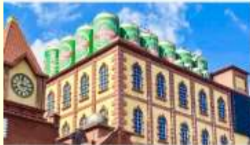
พิพิธภัณฑ์เบียร์ชิงเต่า