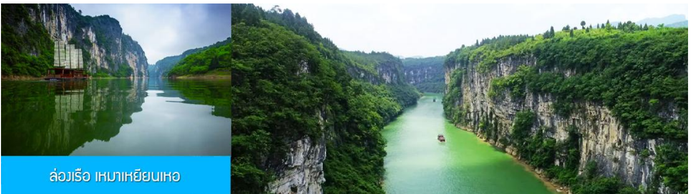
ล่องเรือ เหมาเหยียนเหอ