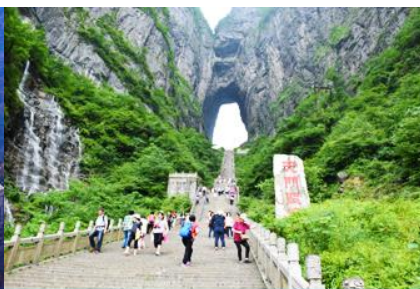
ประตูล้อมรอบ