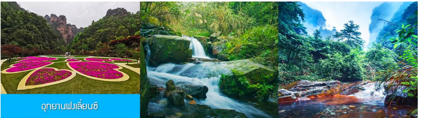
อุทยานฟงเลียนซี