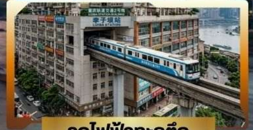
รถไฟฟ้าทะลุตึก