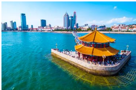
สะพานฉ่านเจียว