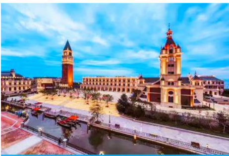
เมืองเวนิสตะวันออก