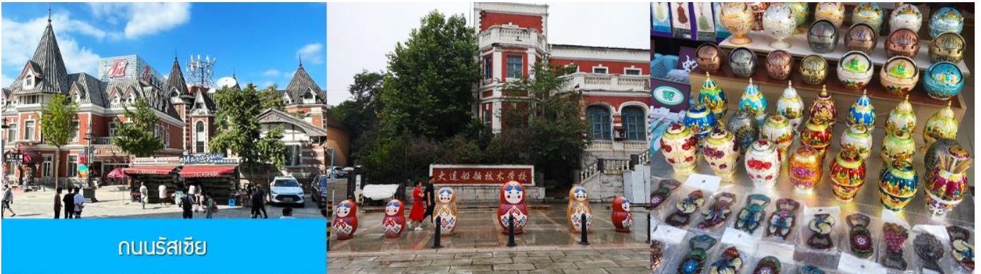
ถนนรัสเซีย