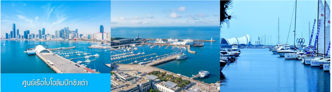
ศูนย์เรือใบโอลิมปิกชิงเต่า

จากนั้นนำท่านเที่ยวชม โรงเบียร์ชิงเต่า 青岛啤酒博物馆 พิพิธภัณฑ์เบียร์ที่ขึ้นชื่อของเมืองชิงเต่า ซึ่งเป็นเบียร์ยี่ห้อแรกที่ผลิตขึ้นในประเทศจีน ชมเบียร์ คอลเลกชันที่มียี่ห้อหลากหลายที่สุดของโลก และชมการจัดแสดงภาพและวิทัศน์เกี่ยวกับวิวัฒนาการของเบียร์ ขั้นตอนการผลิตและอื่น ๆ ที่เกี่ยวข้อง พร้อมชิมเบียร์ชิงเต่า ซึ่งเป็นเบียร์ที่ขายดีที่สุดในยี่ห้อหนึ่งของจีน.. (ชิมเบียร์ชิงเต่าท่านละ 1 แก้ว รับประทานอีก 1 ขวดเล็ก ตอนเดินออก)