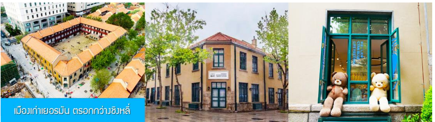
เมืองเก่าเยอรมัน ตรอกกว้างชิงหลี่

จากนั้นนำท่านเดินเที่ยวชม ถนนจงซาน 中山路 ถนนที่เต็มไปด้วยกลิ่นอายยุโรป และถนนสายนี้มีบันทึกเรื่องราวมากกว่าศตวรรษของเมืองชิงเต่าไว้ ที่นี่เป็นศูนย์กลางการค้าแห่งแรกที่เต็มไปด้วยสถาปัตยกรรมสไตล์ยุโรปเก่าแก่ที่ได้รับอิทธิพลมาจากเยอรมัน ให้ท่านได้เดินเก็บบรรยากาศ และ เก็บภาพกับ โบสถ์เซนต์ไมเคิล (ด้านนอก) โบสถ์แห่งนี้ที่คู่รักนิยมมาถ่ายภาพงานแต่งงานด้วยกันมากที่สุดในเมืองชิงเต่า ให้ท่านถ่ายรูปเก็บภาพ