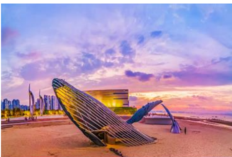
ประติมากรรม วาฬโดดเดี่ยว

จากนั้นนำท่านเดินทางสู่เมืองเยียนไถ 烟台 (ระยะทาง 72 กม. ใช้เวลาเดินทางราว 1 ชั่วโมง)