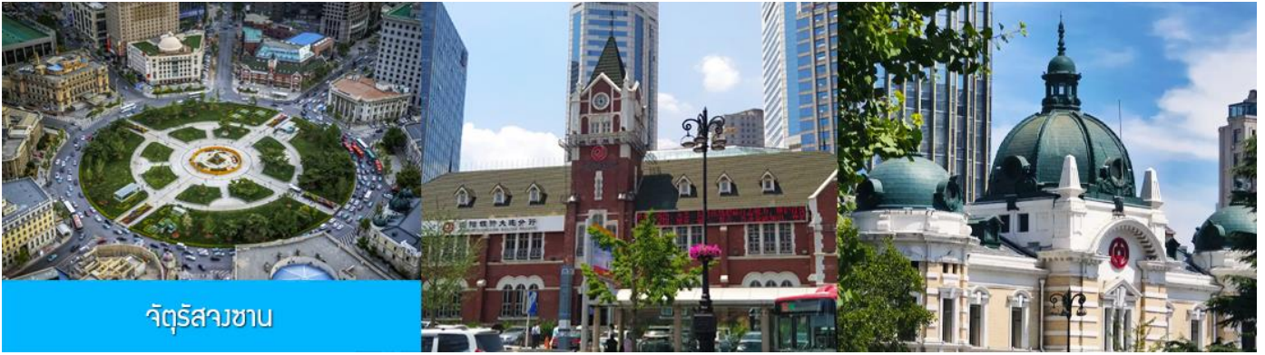
จัตุรัสสวนซาน