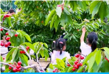
สวนเชอร์รี่