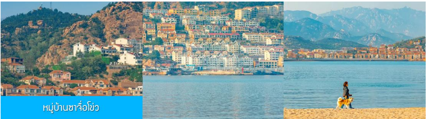
หมู่บ้านซาจื่อโจ้ว

เช้า รับประทานอาหารเช้า ณ ห้องอาหารของโรงแรม (4)