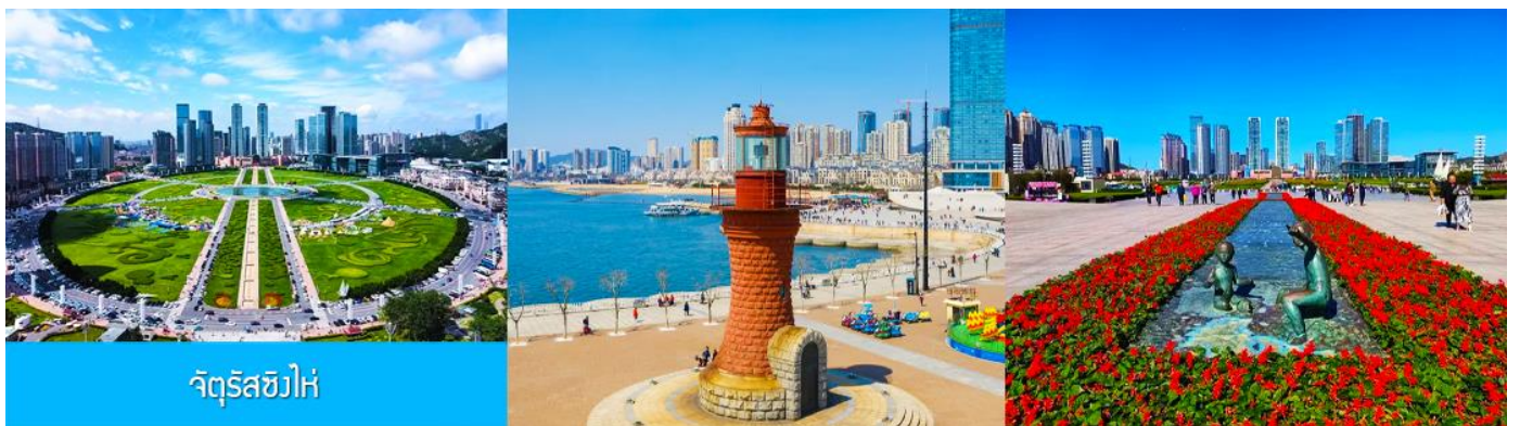
จัตุรัสซิวไห่

จากนั้นนำท่านเที่ยวชมและเก็บภาพ ณ พิพิธภัณฑ์ประวัติศาสตร์หลี่ซุ่น 旅顺博物馆 เป็นอาคารพิพิธภัณฑ์เก่าแก่อายุกว่าร้อยปีแห่งแรกที่สร้างขึ้นทางภาคตะวันออกเฉียงเหนือของจีน อาคารพิพิธภัณฑ์มีความโดดเด่นด้วยสถาปัตยกรรมแบบกรีกโรมันยุคเรเนซองส์ ผสมผสานสถาปัตยกรรมแบบตะวันออก ภายในมีการจัดแสดงโบราณวัตถุกว่า 60,000 ชิ้น ท่านสามารถเก็บภาพที่ระลึกด้านหน้าอาคารพิพิธภัณฑ์ และสามารถเข้าชมโบราณวัตถุภายในพิพิธภัณฑ์ได้ตามอัธยาศัย (พิพิธภัณฑ์ปิดทุกวันจันทร์)..