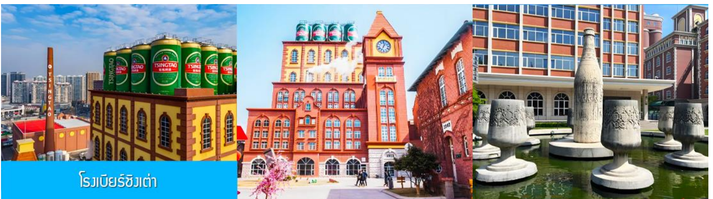
โรงเบียร์ชิงเต่า

รับประทานอาหารกลางวัน ณ ภัตตาคาร *เมนูซีฟู้ด (2)