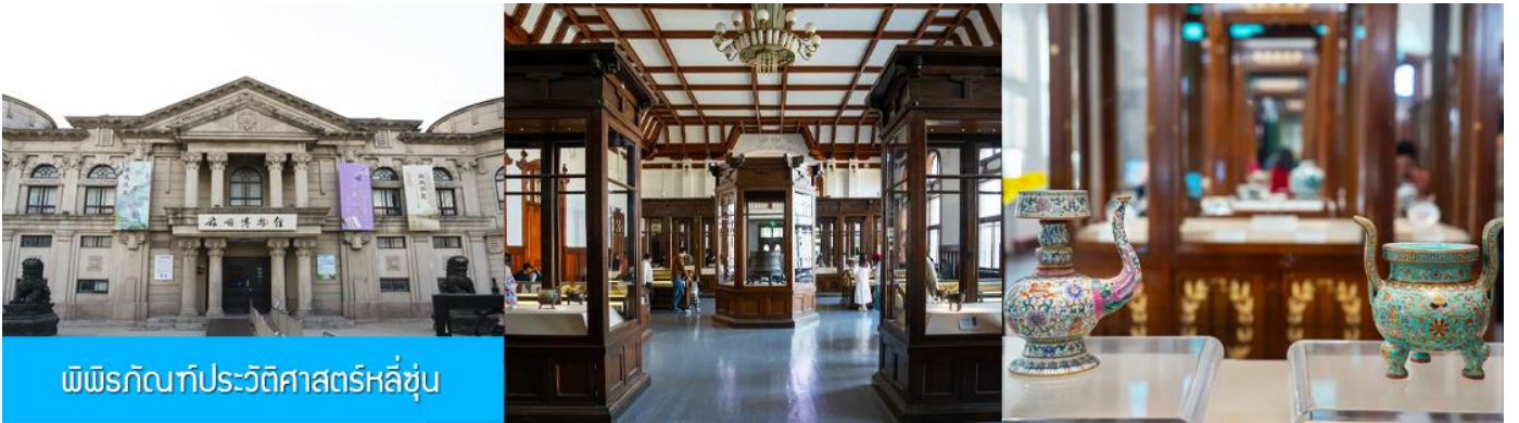
พิพิธภัณฑ์ประวัติศาสตร์หลี่ซุ่น

นำท่านเที่ยวชมและเก็บภาพ ณ สถานีรถไฟหลี่ซุ่น 旅顺火车站 เป็นสถานีปลายทางของเส้นทางรถไฟสาขา เลิ่นหยาง - ต้าเหลียน สร้างขึ้นในปีค.ศ. 1903 ออกแบบโดยสถาปนิกชาวรัสเซีย เป็นอาคารอิฐก่อปูนผสม โครงสร้างไม้ตามสถาปัตยกรรมรัสเซีย.