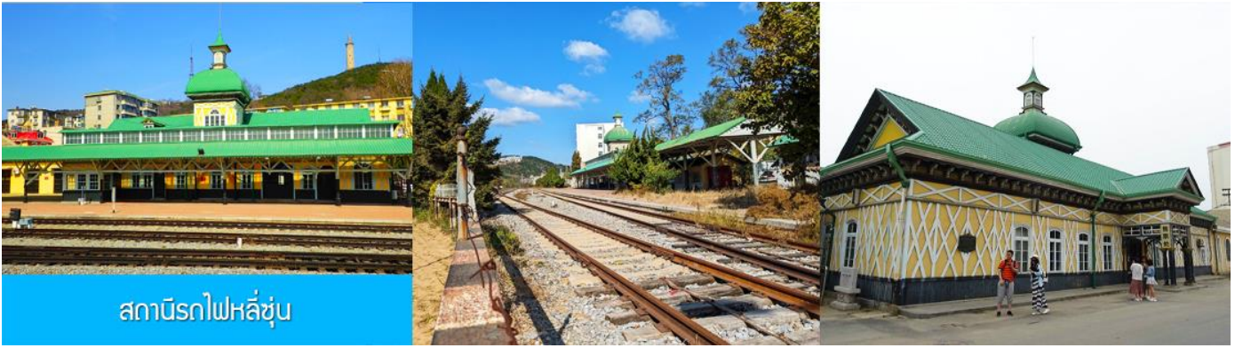
สถานีรถไฟหลี่ซุ่น

นำท่านเที่ยวชมและเก็บภาพ ณ สถานีรถไฟหลี่ซุ่น 旅顺火车站 เป็นสถานีปลายทางของเส้นทางรถไฟสาขา เลิ่นหยาง - ต้าเหลียน สร้างขึ้นในปีค.ศ. 1903 ออกแบบโดยสถาปนิกชาวรัสเซีย เป็นอาคารอิฐก่อปูนผสม โครงสร้างไม้ตามสถาปัตยกรรมรัสเซีย.