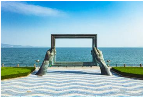
กรอบรูปวิวทะเล