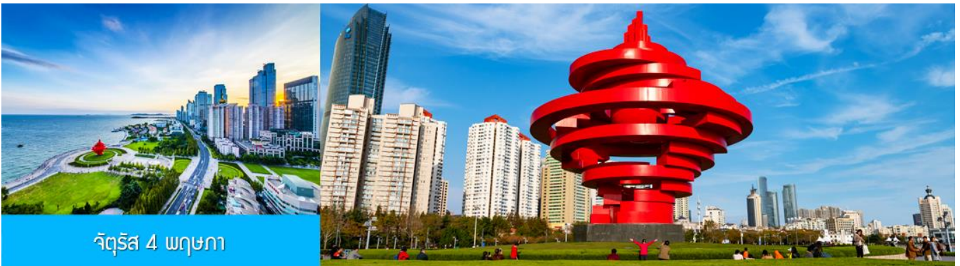
จัตุรัส 4 พฤษภาคม

จากนั้นนำท่านเที่ยวชม ศูนย์เรือใบโอลิมปิกชิงเต่า (Qingdao Olympic Sailing Center) ซึ่งเป็นสถานที่จัดการแข่งขันเรือใบในโอลิมปิกฤดูร้อน 2008 ปัจจุบันเป็นสถานที่ท่องเที่ยวชั้นนำริมทะเลที่สวยงาม มีท่าจอดเรือยอชท์, พื้นที่จัดกิจกรรม, และทิวทัศน์ที่สวยงาม ให้ท่านเก็บภาพบรรยากาศความสวยงามตามอัธยาศัย