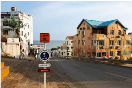
ถนนคอบเพลิงหมายเลข 8

นำท่านชมสวนสาธารณะเว่ยไห่ 威海公园 สวนสาธารณะริมทะเลที่ใหญ่ที่สุดของเมืองเว่ยไห่ ให้ท่านชมและถ่ายภาพคู่กับ กรอบรูปยักษ์วิวทะเล 威海公园大相框 แลนด์มาร์คที่เป็นอีกหนึ่งไฮไลท์ที่สุดฮิตของเว่ยไห่