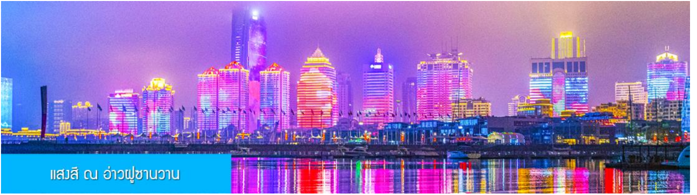
แสงสี ณ อ่าวฟู่ซานวาน

หลังอาหารนำท่านชมความอลังการของแสงสี ณ อ่าวฟู่ซานวาน 浮山湾灯光秀 ชมความอลังการของแสงสียามหัวค่ำ และไฟที่เต้นระบำได้บนตึกสูง และเป็นหนึ่งในไนท์วิวที่สวยงามที่สุดแห่งหนึ่งของจีน..... พักที่ JIFENG INTER HOTEL โรงแรมระดับ 4 ดาวท้องถิ่น ในเมืองเมืองชิงเต่า