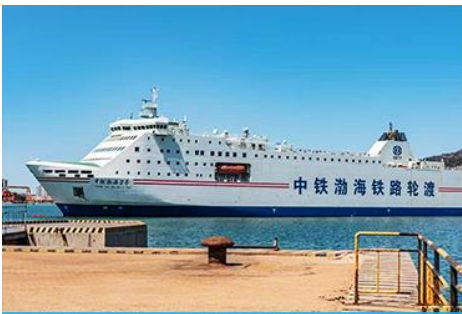
เรือ ZHONGTIE BOHAI CRUISE