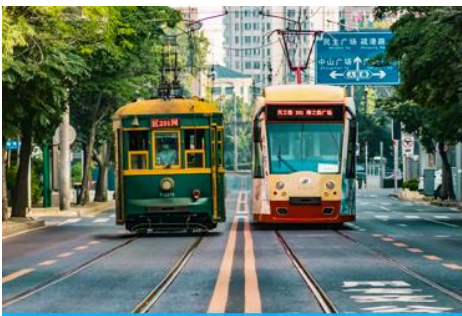
รถรางไฟฟ้า