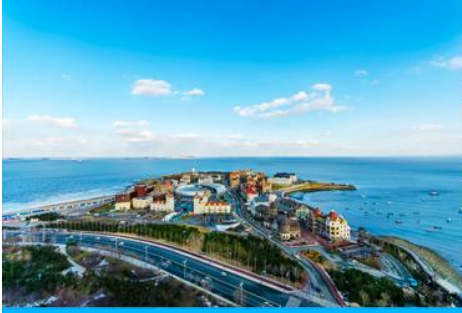
ท่าเรือชาวประมงไห่ซาง