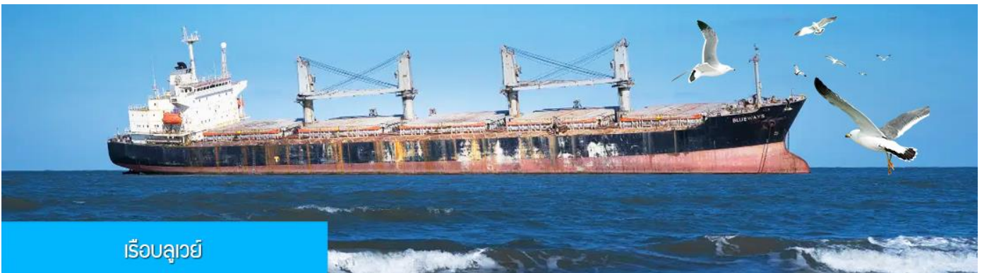
เรือบลูเวย์

เที่ยง รับประทานอาหารกลางวัน ณ ภัตตาคาร (5)