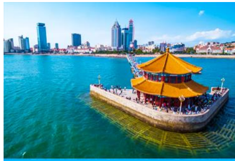
สะพานเจี้ยนเฉียว