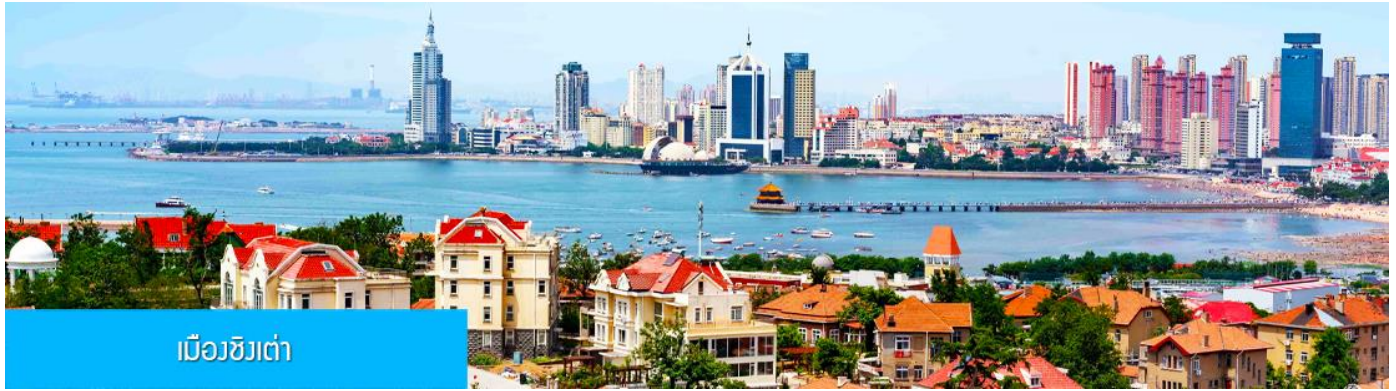
เมืองชิงเต่า