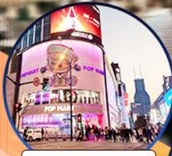
ถนนหนานจิง