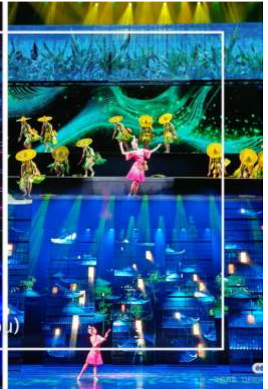
การแสดงโชว์ซีลิ่งคาปู (Xilan Kapu)

เดินทางเข้าโรงแรมที่พัก Xiazhou Hotel ระดับ 4 ดาวหรือเทียบเท่า