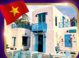
คาเฟ่สุดชิค ซานทรา ฮานอย