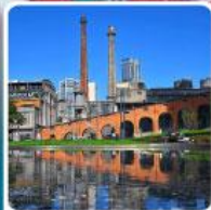
Eastern Suburb Memory Chengdu