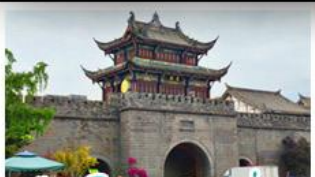
เมืองโบราณกวนเซี่ยน

ภูเขาสดร้อน - อุทยานป่ฝิงโกว - สะพานหนานเฉียว - ร้านหนังสือจงซูเก๋อ - เมืองโบราณกวนเสียน จตุรัสหยางเทียนหวู่ - หมีแพนด้าเซลฟี - ถนนโบราณชอยกว้างชอยแพบ - ถนนคนเดินไท่กู่หลี่ ถนนคนเดินซุนซี - ถนนโบราณจิ้นหลี่ - แพนด้ายักษ์ปิงตึก - น้ำพุไม้ไผ่ตึกSKP - วัดต้าเฉียว