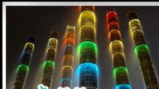
น้ำพุไม้ไผ่ตึกSKP