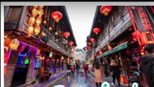
ถนนโบราณจิ้นหลี่