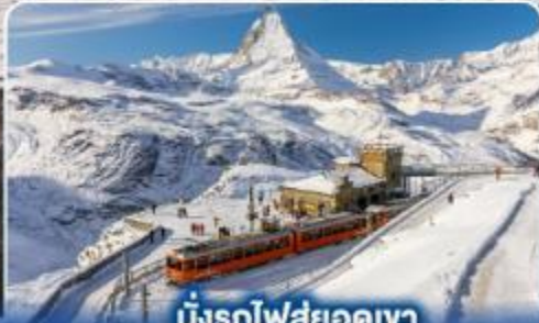
นั่งรถไฟสู่ยอดเขา กรอนเนอร์เกรต