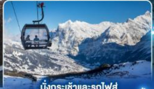
นั่งกระเช้าและรถไฟสู่ ยอดเขาจุงเฟรา