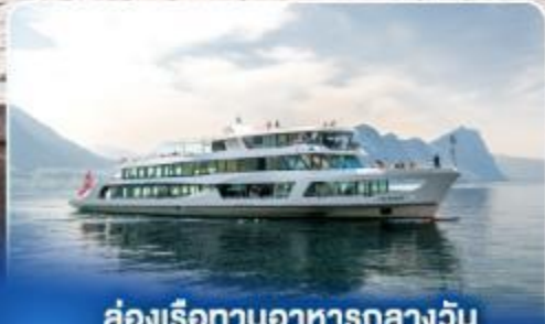
ล่องเรือทานอาหารกลางวัน ทะเลสาบลูเซิร์น