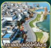
ทะเลสาบเอ๋อไห่คัง S