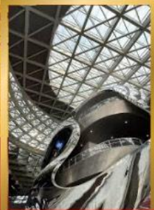
พิพิธภัณฑ์ศิลปะร่วมสมัยเซินเจิ้น