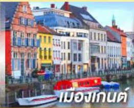
เมืองกันต์