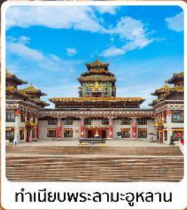
ทำเนียบพระลามะฮูหลาบ