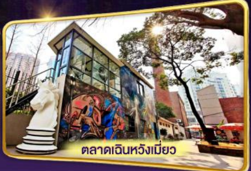
ตลาดเดินห้างเมียว