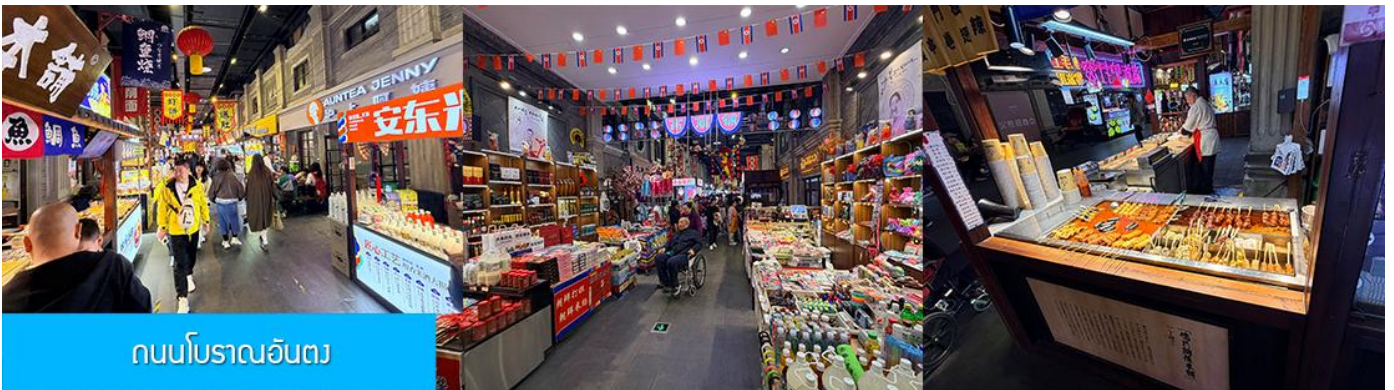
ถนนโบราณอันตง

จากนั้นนำท่านเที่ยวชม ถนนโบราณอันตง 安东老街 ถนนโบราณนี้มีชื่อเสียงในฐานะเป็นย่านการค้าที่คึกคักที่สุดในใจกลางเมืองอันตง (ภายหลังได้เปลี่ยนชื่อเป็นต้นตง) ในปีค.ศ. 1876 ในสมัยราชวงศ์ชิง ปัจจุบันถนนสายนี้ยังคงไว้ซึ่งอาคารบ้านเรือนยุคเก่า(ราชวงศ์ชิง) และอบอวลด้วยวัฒนธรรมพื้นเมืองโบราณ ท่านจะได้สัมผัสการละเล่นและการแสดงพื้นเมือง ร้านค้าจำหน่ายของที่ระลึก ร้านอาหารท้องถิ่น และสตรีทฟู้ด ฯลฯ