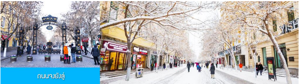
ถนนมายังลู่

หลังอาหารนำท่านชม อนุสาวรีย์สังหิง 防洪纪念碑 อนุสรณ์ของชาวเมืองฮาร์บินที่ถูกจารึกในประวัติศาสตร์ ในการเอาชนะอุทกภัยธรรมชาติครั้งใหญ่ในปี ค.ศ. 1957