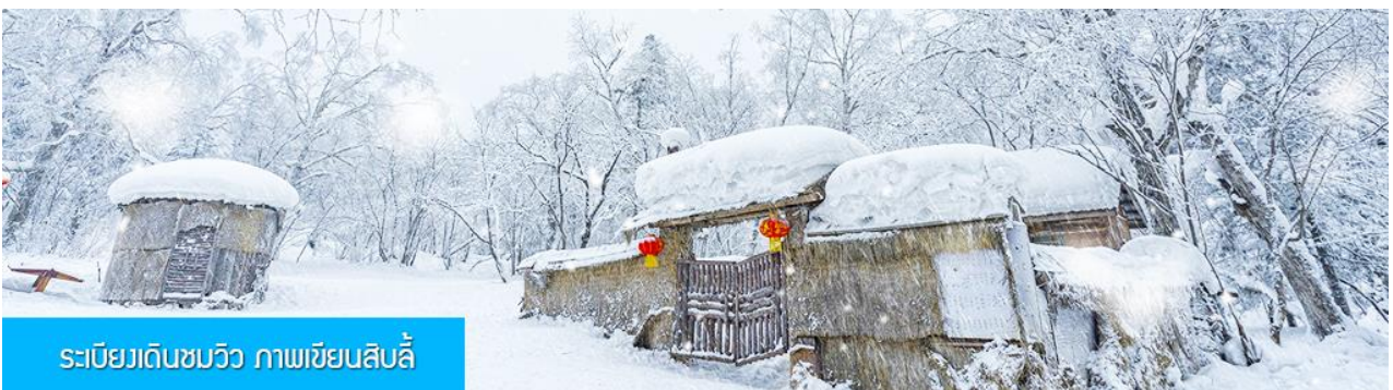
ระเบียบเดินชมวิว ภาพเขียนสิบสี่