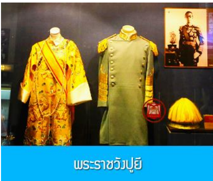
พระราชวังปูยี

หลังอาหารนำท่านเช็คเอาท์ออกจากโรงแรมที่พักแล้วเดินทางสู่ เมืองฉางชุน 长春市 (ระยะทาง 120 กม.ใช้เวลาเดินทางราว 1 ชั่วโมงครึ่ง)