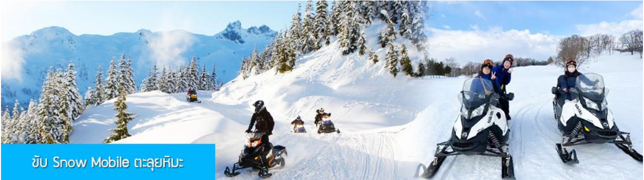
ขับ Snow Mobile ตะลุยหิมะ

ไกด์ท้องถิ่นนำเสนอโปรแกรมเสริม หรือ OPTIONAL TOUR ให้ท่านเลือกตามความสมัครใจ