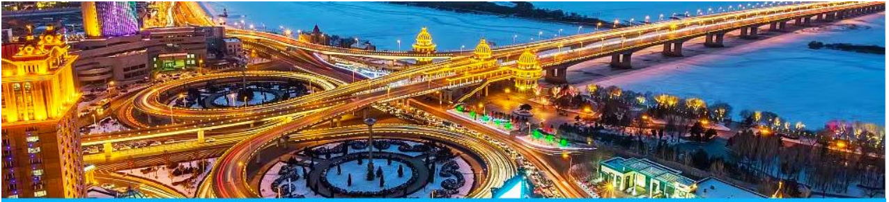
นครฮาร์บิน