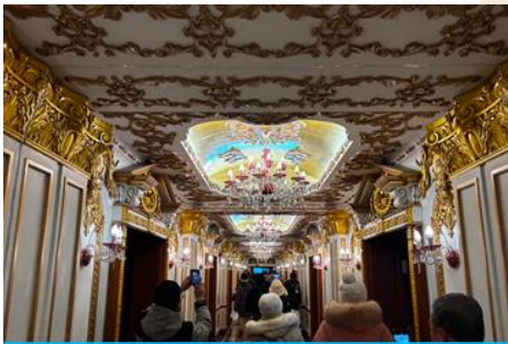
ตึกเภสัชกรรมฮาร์บิน

จากนั้นนำท่านเที่ยวชม ถนนจงยังลู่ 中央大街 ถนนสายหลักของเมืองฮาร์บิน ถนนที่เต็มไปด้วยอาคารบ้านเรือนที่เป็นสถาปัตยกรรมตะวันตกที่สร้างในช่วงคริสต์ศตวรรษที่ 18 – 19 ที่เมืองนี้ถูกปกครองโดยรัสเซีย อีกทั้งเป็นถนนคนเดินที่เป็นแหล่งรวมร้านค้าสินค้าแบรนด์เนมทั้งในและต่างประเทศ ร้านจำหน่ายของที่ระลึกและสินค้าพื้นเมือง ร้านอาหารพื้นเมืองต่าง ๆ มากมาย ให้ท่านมีเวลาอิสระเดินเที่ยวและช้อปปิ้ง หรือลิ้มรสอาหารพื้นเมืองตามอัธยาศัย.. **ให้ท่านลิ้มรสไอศกรีมชื่อดังเก่าแก่ของเมืองฮาร์บินท่านละ 1 ท่านฟรี