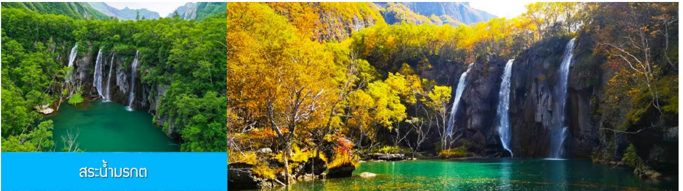
สระน้ำมรกต

หลังอาหารนำท่านเที่ยวชม ยอดเขาฉางไป่ซาน 长白山 (จีน/ลงเนินด้านทิศเหนือ) ชมความงามที่เร้นลับของ ทะเลสาบเทียนฉือ 天池 ที่เชื่อกันว่าเป็นแหล่งน้ำศักดิ์สิทธิ์ที่อยู่ใกล้สวรรค์จนเป็นที่มาของคำว่าเทียนฉือที่แปลว่าทะเลสาบบนสวรรค์ ชม น้ำตกเขาฉางไป่ซาน 长白山瀑布 เป็นน้ำตกที่ไหลลงมาจากหน้าผาขนาดใหญ่ที่มีความสูง 68 เมตร น้ำตกแห่งนี้เป็นจุดน้ำไหลออกของทะเลสาบเทียนฉือ และเป็นต้นกำเนิดของแม่น้ำซงฮัวเจียง....ชม สระน้ำมรกต 绿渊潭 สระน้ำสีเขียวมรกตที่มีน้ำตกน้อยสองสายที่คอยเติมน้ำเข้าไปในสระ เป็น