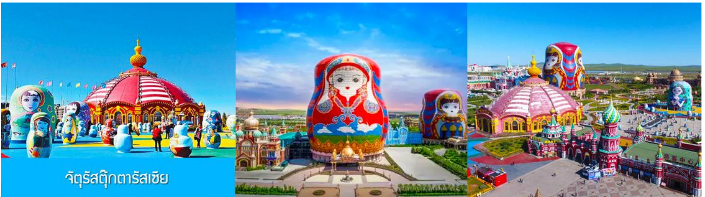
จัตุรัสตุ๊กตารัสเซีย