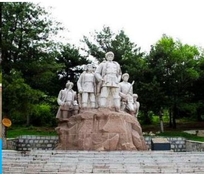
อนุสาวรีย์พิงหวง