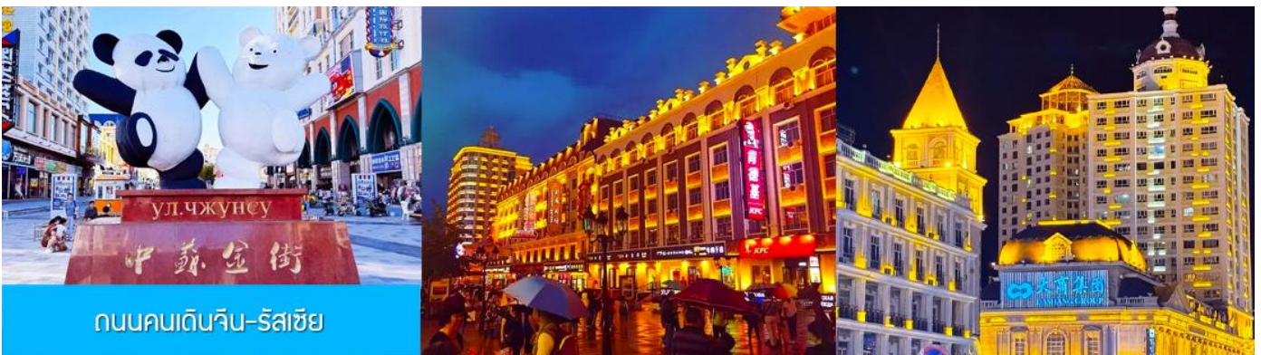
ถนนคนเดินจีน-รัสเซีย

ท่านสามารถเดินเที่ยวชม บริเวณจัตุรัสฯ เก็บภาพสวยงามของสถาปัตยกรรมสวยเก๋แบบรัสเซีย เที่ยวชมบริเวณล็อบบี้ของโรงแรมตุ๊กตารัสเซีย ที่มีการตกแต่งภายในอย่างวิจิตร งดงามทั้งลวดลายการตกแต่งและภาพสีน้ำมัน