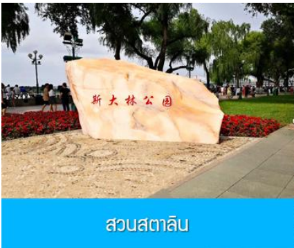
สวนสตาลิน