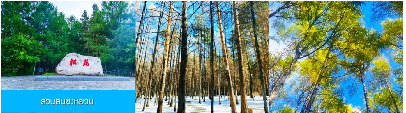
สวนสนขงหยวน

เช้า รับประทานอาหารเช้า ณ ห้องอาหารของโรงแรม (22)