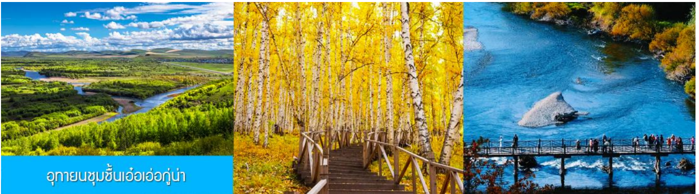
อุทยานชุ่มชื้นเอ้อเอ่อกู่่น่า

เช้า รับประทานอาหารเช้า ณ ห้องอาหารของโรงแรม (16)