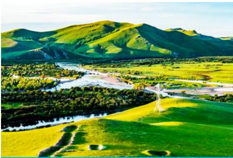
ภูเขาเหยซานโถว

เช้า รับประทานอาหารเช้า ณ ห้องอาหารของโรงแรม (13)