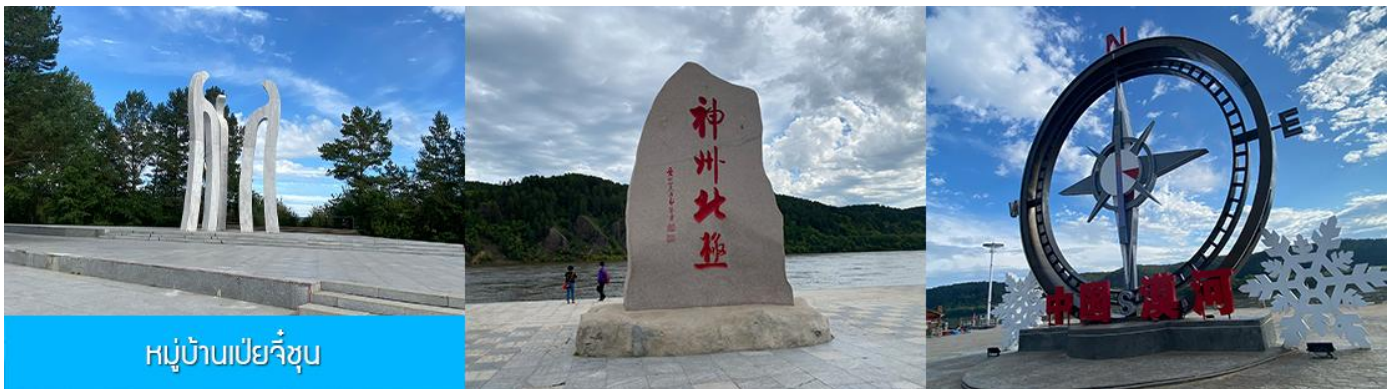
หมู่บ้านเป่ย์จี้ซุน

เที่ยง รับประทานอาหารกลางวัน ณ ร้านอาหารระหว่างทาง (20)