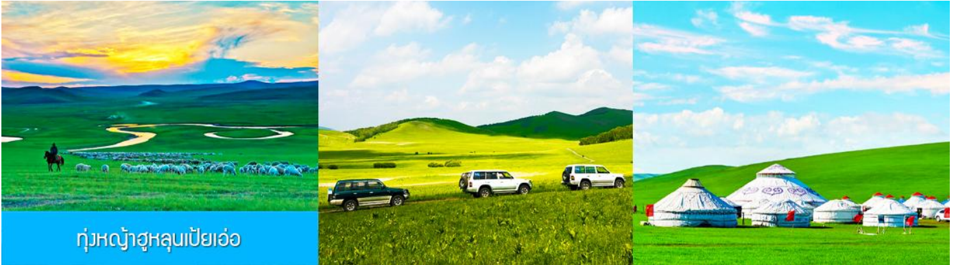
ทุ่งหญ้าฮูลุนเปียวเอ๋อ