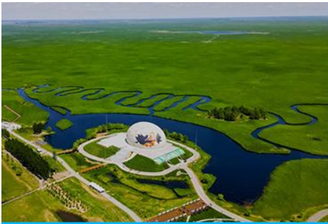
อุทยานชุ่มชื้นจาหลง

เช้า รับประทานอาหารเช้า ณ ห้องอาหารของโรงแรม (7)