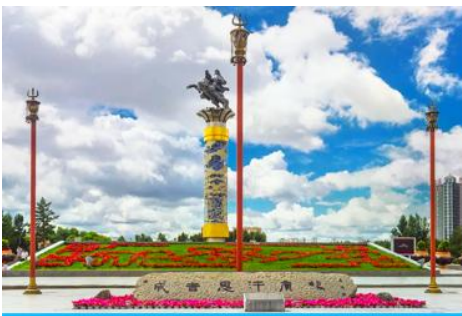
จัตุรัสวงกิสข่าน

หลังอาหารนำท่านเดินทางสู่เมือง ไห่ลาเอ๋อ 海拉尔市 (ระยะทาง 456 กม. ใช้เวลาเดินทางราว 5 ชั่วโมงครึ่ง)