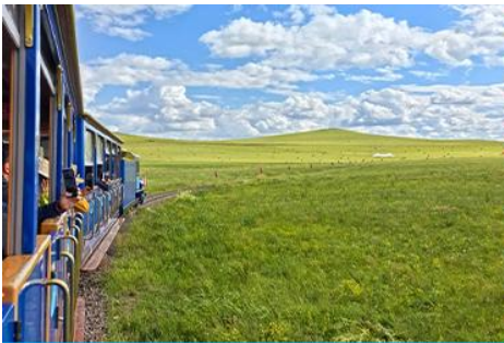
ชมบ้านชาวมองโก

เที่ยง รับประทานอาหารกลางวัน ณ ภัตตาคาร (14)