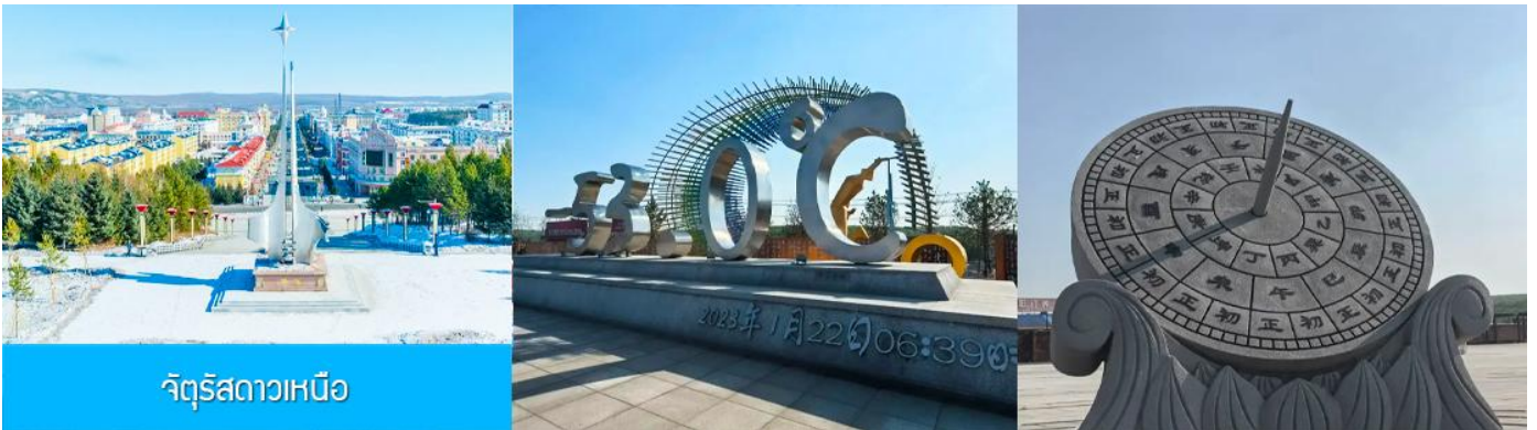
จัตุรัสดาวเหนือ