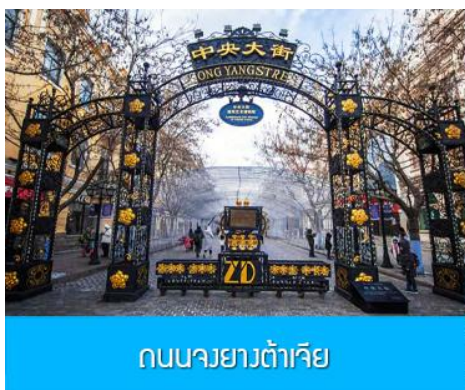
ถนนจงยางต้าเจีย