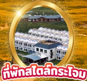
ที่พักสไตล์กระโจม