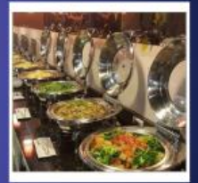
RENYI LAKE HOTEL

หมายเหตุ: **ปัจจุบันโรงแรมได้หวั่นมีนโยบายเพื่อลดโลกร้อน ตั้งแต่ปี 2568 เป็นต้นไป** โรงแรมที่พักงดบริการแจก สบู่ แชมพู ครีมนวด และผลิตภัณฑ์ดูแลผิวส่วนรวม *สิ่งที่ต้องเตรียมของใช้ส่วนตัวไปเอง! ครีมนวด แชมพู ครีมนวด โลชั่น หมวกอาบน้ำ หวี แปรงสีฟัน ยาสีฟัน และของใช้ส่วนตัวอื่นๆ เพื่อสุขอนามัยที่ดีและเป็นมิตรกับโลกลดโลกร้อนรักษ์โลก...พกของใช้ส่วนตัว สบายใจ ไร้กังวล