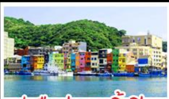
ทำเรือประมงเจิ้งปิ่น

รถไฟสายโบราณอาลีซาน - ตักไทเป 101 ประมงเจิ้งปิ่น - จิวเฟิ่น - ล่องเรือทะเลสาบสุริยันจันทรา ถนนเมบูเค็ด เสี่ยวหลงเป่า & ปลายประธาราธิบดี ช้อปปิ้ง 3 ย่านดัง : ซีเหมินดิง - ไถจงไนท์มาร์เก็ต - MITSUI OUTLET