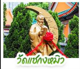
วัดเข่งหมิง