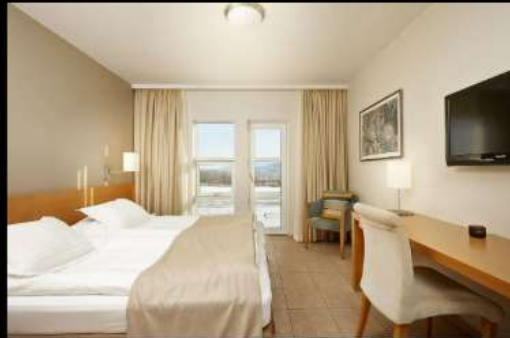
***รูปภาพเพื่อประกอบการโฆษณาเท่านั้น***