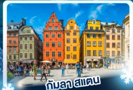
กับลาสาเตน