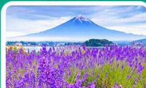
สวนโออิชิปาร์ก