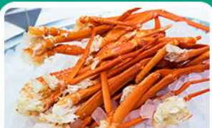
พิเศษ! บุฟเฟ่ต์ขาปู