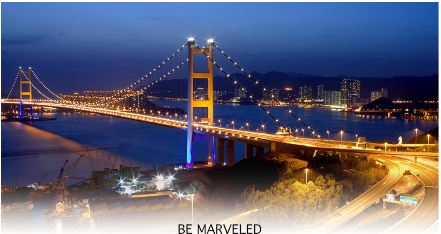
BE MARVELED สะพานแขวนชิงหม่า

17.40 น. เดินทางถึง สนามบินเซ็กแล็บก๊อก (CHEK LAP KOK INTERNATIONAL AIRPORT) เขตปกครองพิเศษฮ่องกง หลังผ่านพิธีการตรวจคนเข้าเมืองเป็นที่เรียบร้อยแล้ว รับกระเป๋าสัมภาระ เดินทางโดยรถโค้ชปรับอากาศ (เวลาที่ท้องถิ่นที่ฮ่องกง เร็วกว่าประเทศไทย 1 ชั่วโมง)