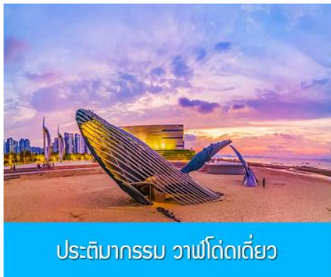
ประติมากรรม วาฬโด้ดเดี่ยว

05.30 น. เรือท่องเที่ยวขนาดคณะเดินทางถึงท่าเรือเมืองเยียนไถ นำท่านขึ้นรถบัสเพื่อเดินทางสู่ตัวเมืองเยียนไถ เช้า รับประทานอาหารเช้า ณ ห้องอาหารของโรงแรม (7) หลังอาหารนำท่านเที่ยวชม ท่าเรือชาวประมงไห่ซาง 烟台海昌鱼人码头 ท่าเรือนี้เต็มไปด้วยสถาปัตยกรรม สไตล์อเมริกันเหนือ และยุโรป ให้ท่านได้สัมผัสและเก็บภาพบรรยากาศที่แสนโรแมนติกริมทะเล ที่มีอาคาร