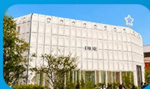
บรักคินกาหลี่