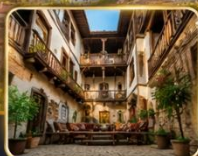
บ้านเรือนสไตล์ออตโตมัน อายุกว่า 200 ปี

เมืองท่องเที่ยวที่มีชื่อเสียงของจังหวัดการาบิก (Karabük) ในปี 1994 เมืองซาฟรานโบลู ได้ถูกองค์การยูเนสโกยกให้เป็น มรดกโลกทางด้านวัฒนธรรม