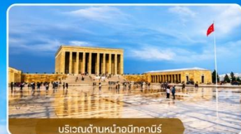
บริเวณด้านหน้าอนิคาบิร์

สถานที่สำคัญที่คนตุรกีให้ความเคารพและจดจำผู้นำผู้ยิ่งใหญ่ ที่อุทิศทั้งชีวิตเพื่อชาติ ศาสนา และประชาชน