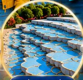
ปานุกคาล์ Pamukkale