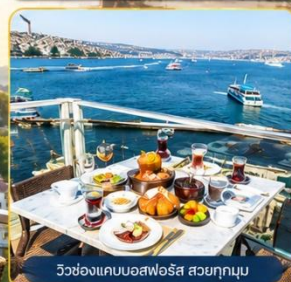
วิวช่องแคบบอสฟอรัส สวยทุกมุม