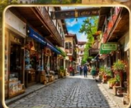
เดินเล่นย่านเมืองเก่า บรรยากาศย้อนยุค