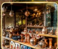
เลือกซื้อของฝาก งานหัตถกรรมพื้นเมือง

สัมผัสเสน่ห์แห่งอดีตในเมืองที่เวลาเดินช้าลง กับสถาปัตยกรรมอันงดงาม วัฒนธรรมที่ยังคงมีชีวิต และความอบอุ่นจากผู้คน