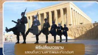
พิธีเปลี่ยนเวรยาม แสดงถึงความเคารพและเกียรติยศ

ได้เวลาเดินทางทางสู่เมือง "ซาฟรานโบลู" (Safranbolu) คือเมืองท่องเที่ยวที่มีชื่อเสียงของจังหวัดการาบิก (Karabük) ในภูมิภาคทะเลดำตุรกี เป็นเมืองที่มีความสำคัญทางด้านประวัติศาสตร์ของประเทศ ตุรกี โดยเฉพาะชื่อเสียงเกี่ยวกับสถาปัตยกรรมซาฟรานโบลู ที่มีอิทธิพลต่อพัฒนาการชุมชนเมืองทั่วทั้งจักรวรรดิออตโตมัน ต่อมาในปี 1994 เมืองซาฟรานโบลู ได้ถูกองค์การยูเนสโกยกให้เป็นมรดกโลกทางด้านวัฒนธรรม