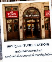
สถานีทูเนล (TUNEL STATION) สถานีรถไฟใต้ดินสายเก่าแก่ และเป็นหนึ่งในระบบขนส่งที่เก่าแก่ที่สุดในโลก