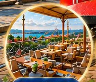
Seven Hills Cafe ชมวิว อิสตันบูล