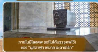
ภายในโถงศพ (แต่ไม่ได้บรรจุศพไว้) ของ "มุสตาฟา เคมาล อะตาเติร์ก"