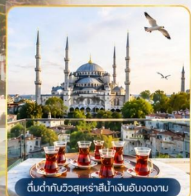
ต้นตักกับวิวสุเหร่าสีน้ำเงินฮาดองกาน

พิเศษ...สุดๆ! นำท่าน ขึ้นสู่จุดเช็คอินแห่งใหม่ Seven Hills Café ซึ่งเป็นสถานที่ยอดนิยมขณะนี้..บนชั้นดาดฟ้า ของโรงแรมเซเวนฮิลล์ส ท่านจะได้ถ่ายรูปกับวิวมุมต่าง ๆ ช่องแคบบอสฟอรัส, สุเหร่าสีน้ำเงินและสุเหร่าฮาเกียโซเฟีย พร้อม ให้อาหาร กับเหล่านกนางนวลที่จะบินมารับอาหารจากท่าน **ขออนุญาตท่านที่ชื่นชมความงามวิวกว้อยล้ำ ช่วยอุดหนุนเครื่องดื่ม ชา กาแฟ ซอฟดริงค์ อื่นๆ ตามต้องการ