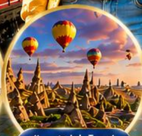
เมืองคปปาโดเกีย Cappadocia