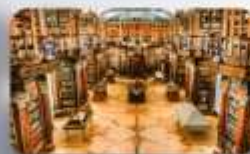
หอสมุดมรดกโลก St.Gallen