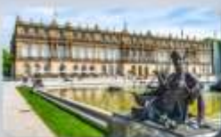
พระราชวัง Herrenchiemsee