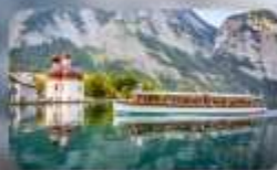
ทะเลสาบโคนิกซ์