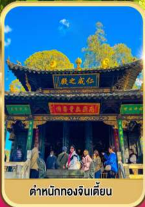
ตำหนักทองจินเตียน